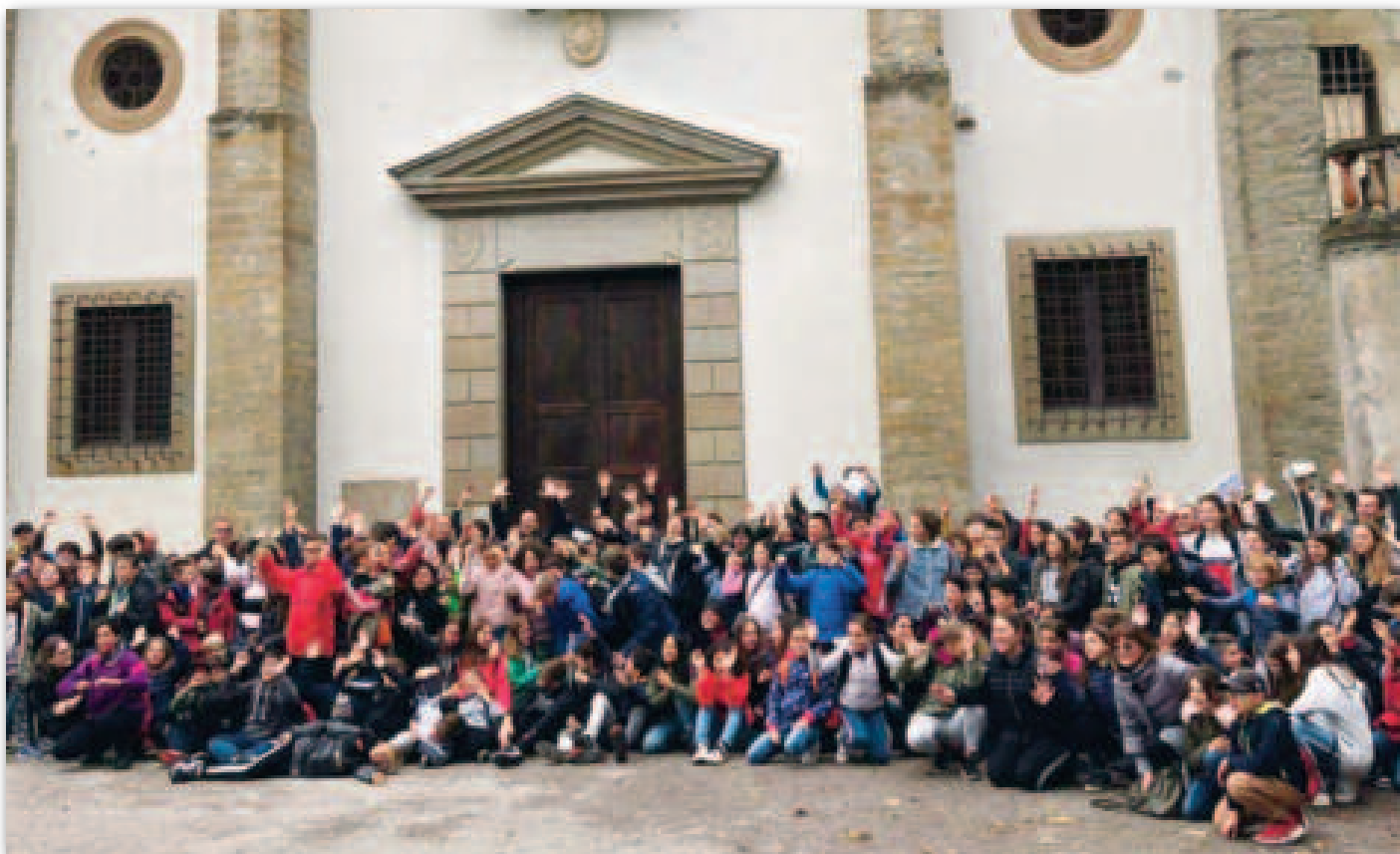
300 ragazzi del Graal di Romagna anche dalla parrocchia di Coriano (Forlì)