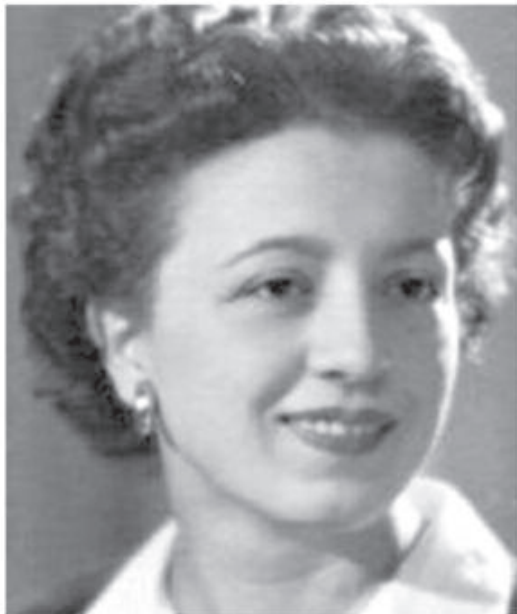
La beata Benedetta Bianchi Porro, nata a Dovadola e morta a Sirmione in provincia di Brescia

La Bianchi Porro ha ricordato poi che la sorella nel 1951 si trasferì e visse i suoi ultimi giorni proprio a Sirmione, in provincia di Brescia. Quella stessa provincia oggi è una delle zone colpite in modo più drammatico dal covid-19. Pertanto la storia di questa bambina commuove per vari aspetti, anche perché il padre è in quarantena mentre la