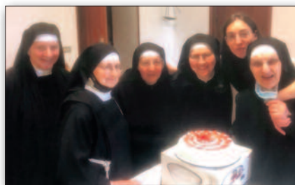
Monache del monastero di Montepaolo