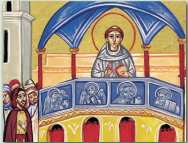
A. TREBBI, Sant'Antonio predica a Forlì , part., icona

Frate Antonio aveva bisogno di ricomporre tanti frammenti della sua vita, dei suoi sogni. Così diversi dalla realtà. Solo nel silenzio poteva ritrovare una ricomposizione e il senso delle sue scelte, far tacere le molte voci che si affollavano dentro di lui. Avrebbe scelto anche una "caverna-grotta" per ascoltare il silenzio.