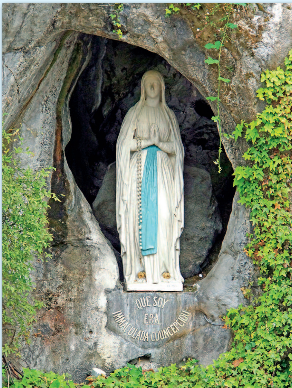
Nostra Signora di Lourdes

Semestrale - Poste Italiane s.p.a. - Sped. abb. post. - D.L. 353/2003 (conv. in L. 27/02/2004 n. 46) art. 1, comma 2 - DCB di Forlì - Aut. Trib. Forlì n. 18/86 - Dir. Resp.: Alessandro Rondoni - "Ass. per Benedetta Bianchi Porro" Sede: Piazza Cesare Battisti, 1 - 47013 Dovadola (FC) - info@beatabenedetta.org - www.beatabenedetta.org - c.c.p. 1044470506 - BCC IBAN IT54X0854213200000000265778 - Stampa: Stilgraf Cesena