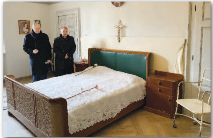
Il Cardinale e il Vescovo accanto al letto dove morì Benedetta

Qui sta la ragione ultima della gioia cristiana, che dovrebbe irradiare dal nostro volto e dare luce alle nostre