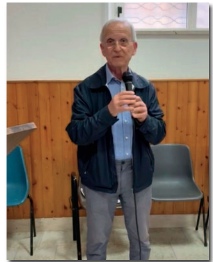
Un momento della testimonianza ad Ostuni