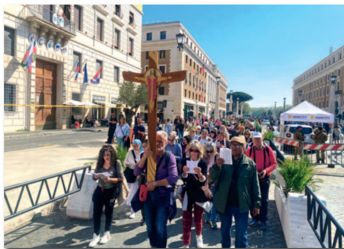
I pellegrini in processione

Varcare la Porta Santa, percorrere la Basilica, fermarsi davanti all'altare della Confessione è confermare col Credo la fede nella Chiesa di Cristo affidata agli Apostoli e a Pietro (Papa Francesco non era pre-