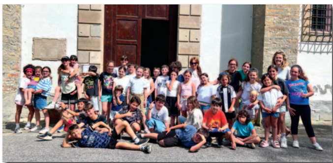
Famiglie e bambini San Giuseppe al Porto di Rimini