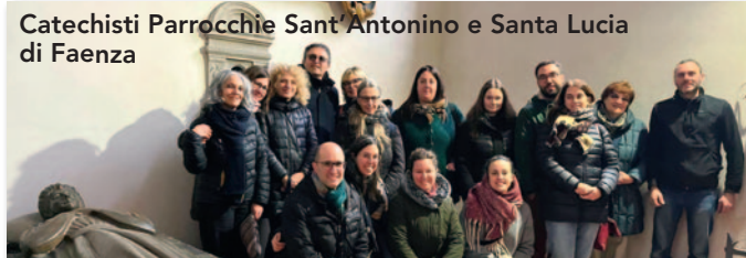
Catechisti Parrocchie Sant'Antonino e Santa Lucia di Faenza