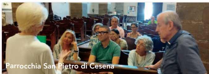
Parrocchia San Pietro di Cesena