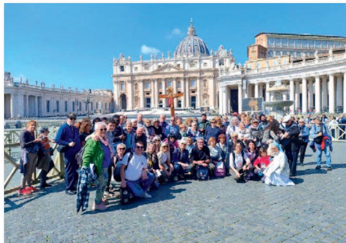
In piazza San Pietro