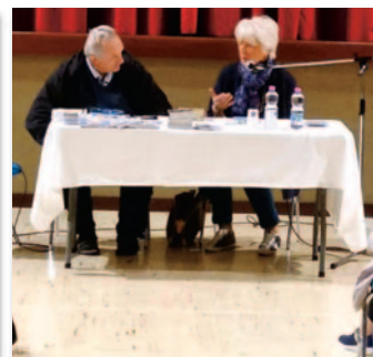
Parrocchia di Bussecchio di Forlì